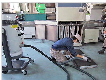
▲集塵機フィルターのメンテナンスにも大活躍！