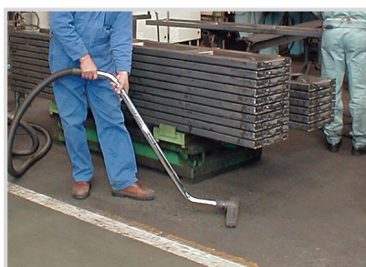
▲余裕の回収力で大量の微粉をストレスなく吸引！