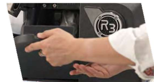
マグネット式のカバー