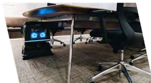
アンダーテーブル(70cm)