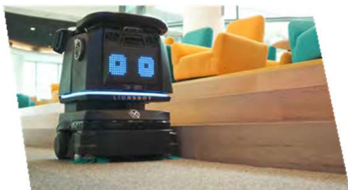
0cm エッジクリーニング

コンパクトなサイズとプロ仕様のクリーニングメカニズムで、R3 Vacはカーペットでもハードフロアでも、最高のクリーンさをお届けします。