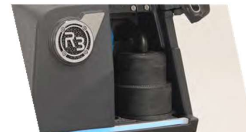
簡単にアクセスできるバ キュームモーター