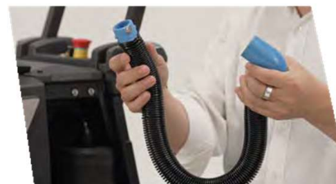
着脱式バキュームホース