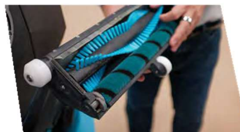
簡単に交換できる フロアツール

R3 Vacは使いやすいだけでなく、メンテナンスも簡単です。分解に工具を必要としないマグネット式のデザインを採用し、メンテナンスのために重要なエリアに完全にアクセスできるようになっています。