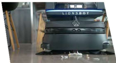
シングルパスフロアツール