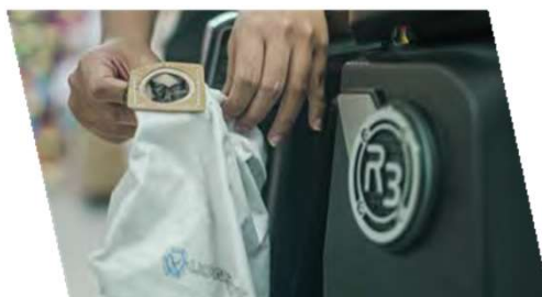
マイクロファイバードストバッグ