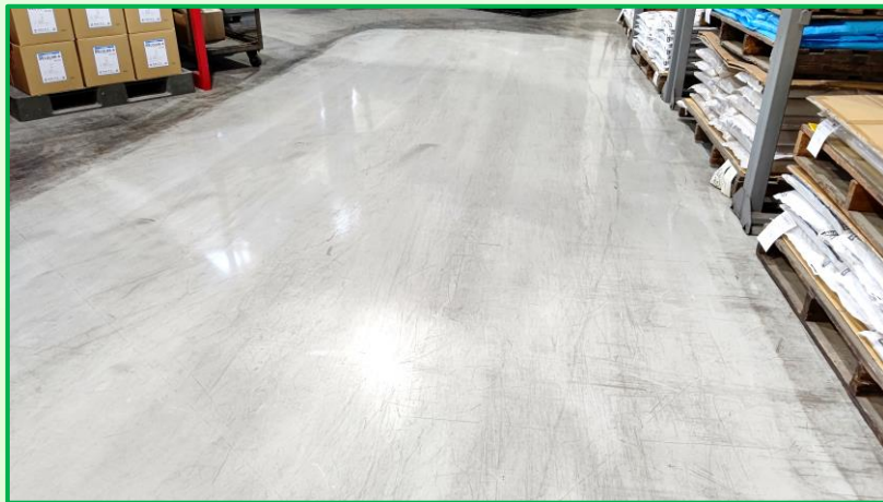
光沢を向上させながら強力洗浄！

研磨剤による擦り傷が残ってしまうと光沢が失われるだけでなく「汚れやすく」「汚れが取れない」床になってしまう。