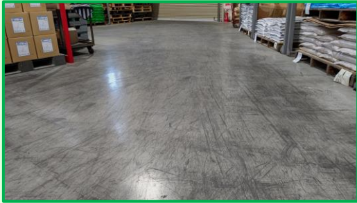
タイヤ痕で汚染された塗床