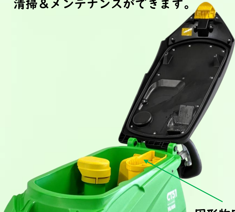
固形物回収バケット