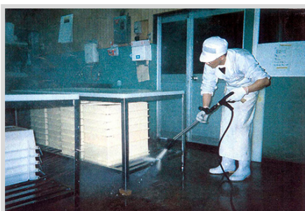
▲食品工場床の洗浄