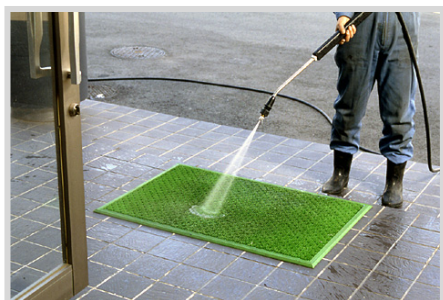
▲建物エントランスの洗浄