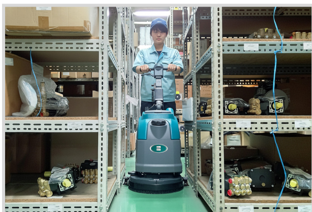
▲狭小エリアの洗浄