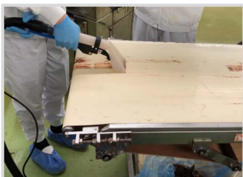
▲ハンドツールを使用してコンベア洗浄