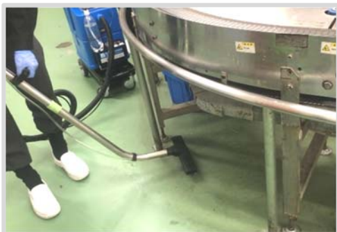
▲入り組んだ製造ライン周りの洗浄