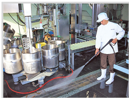
▲ 食品工場の設備や床などの洗浄