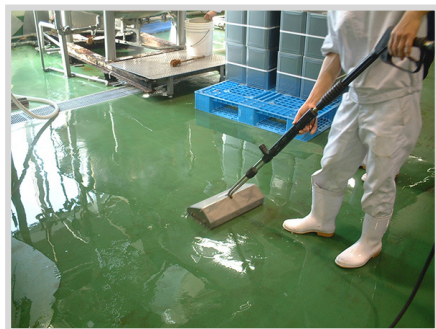
▲ 選択付属品ジェットブルームを使用