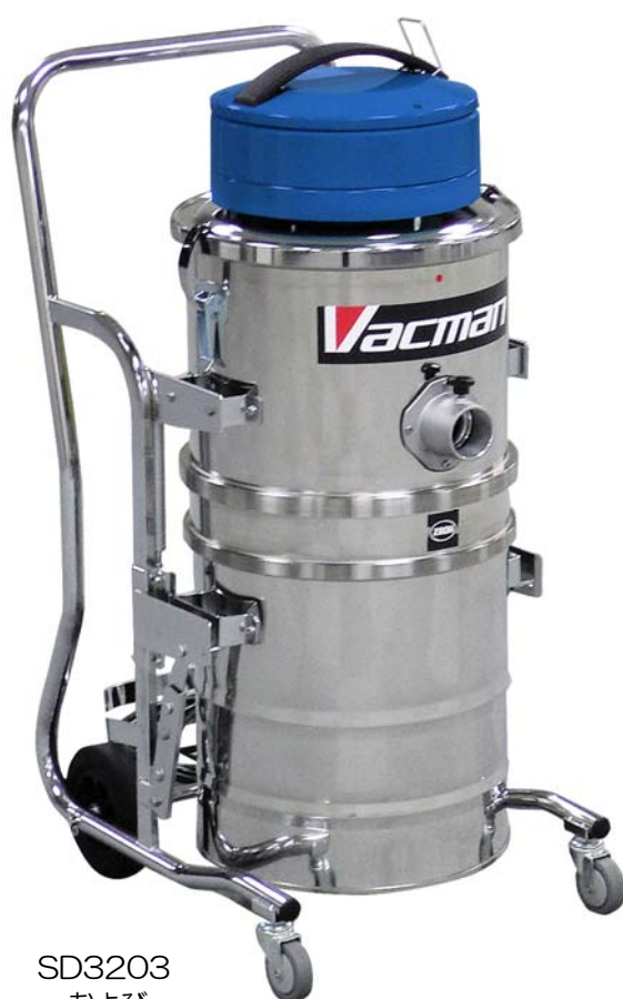
SD3203 および SD3203B