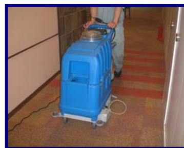
● 前進走行で操作性抜群！