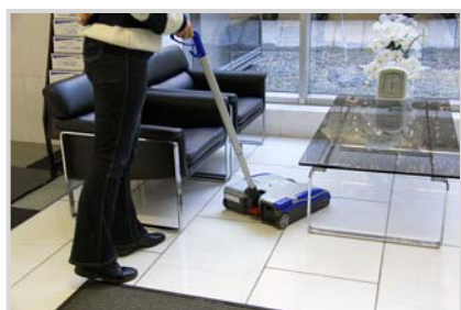
▲ハードフロアの清掃