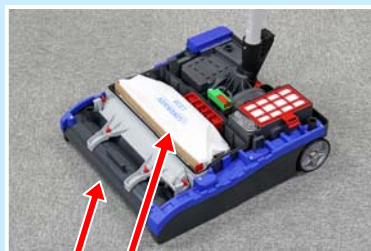
吸引口 ダストバッグ

● 吸引口とダストバッグが近接しているためエネルギーロスが抑えられ、モーターパワーを最大限に活かして効率よく吸引します。