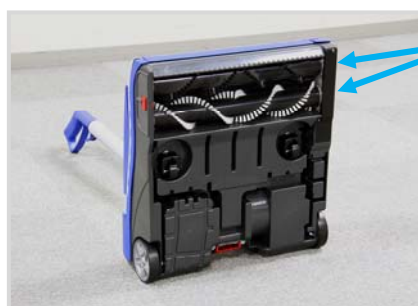
ソフトと ハードの ツインブラシ