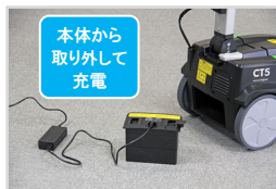
本体から取り外して充電