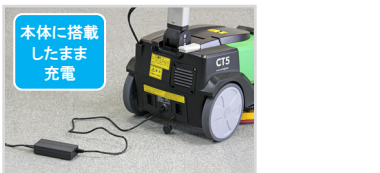
本体に搭載したまま充電