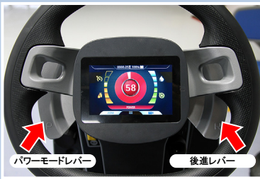
パワーモードレバー 後進レバー