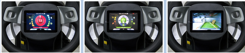
▲洗浄モード: パワーモード ▲洗浄モード: エコモード ▲ 後方映像を確認