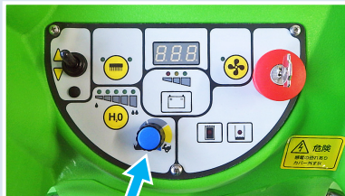
*速度調整ダイヤル