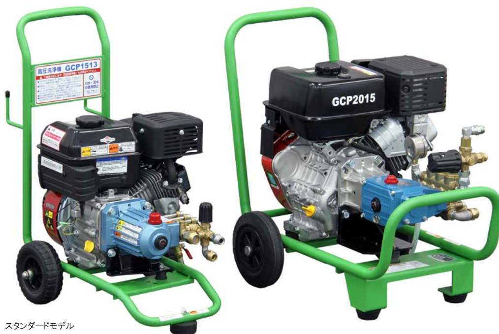
スタンダードモデル GCP1513