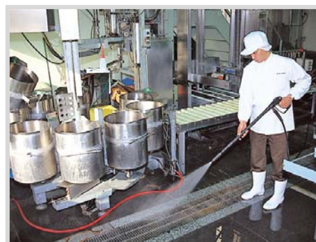
▲ 食品加工工場の洗浄