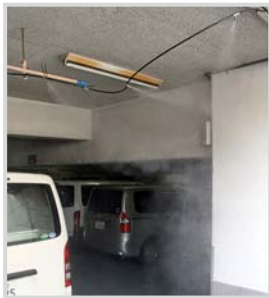
▲地下駐車場出入りに