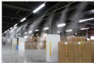
▲倉庫内をクールダウン