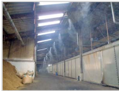
▲各種農業施設内などの熱中症対策、防塵対策、静電気対策にも