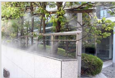
▲ヒートアイランド対策に