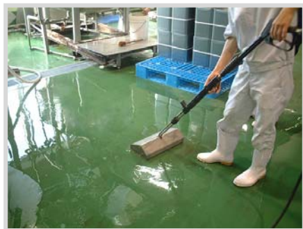
▲ 選択付属品ジェットブルームを使用