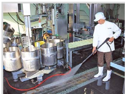
▲ 食品工場の設備や床などの洗浄