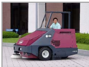
▲オーバーヘッド・ガード使用例