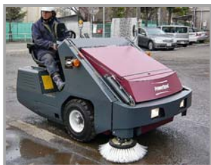
▲回転灯、サイドミラー、方向指示灯 使用例