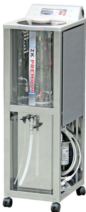
スタンダードタイプ ZKプレミアム