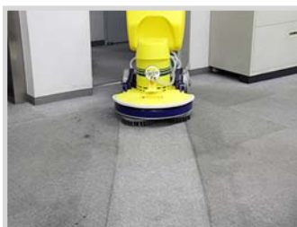
▲カーペット洗浄に