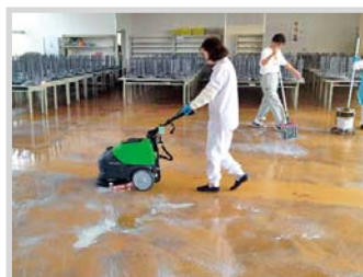
▲ワックス床の洗浄や剥離作業に