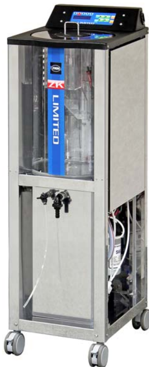
連続生成タイプ ZKリミテッド